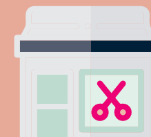
En salon, en cabine individuelle