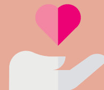
Diverses associations (Ligue contre le cancer...)