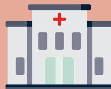
Hôpital et cliniques publiques ou privées