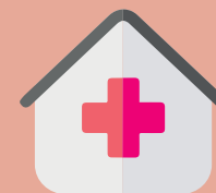
Centre de lutte contre le cancer